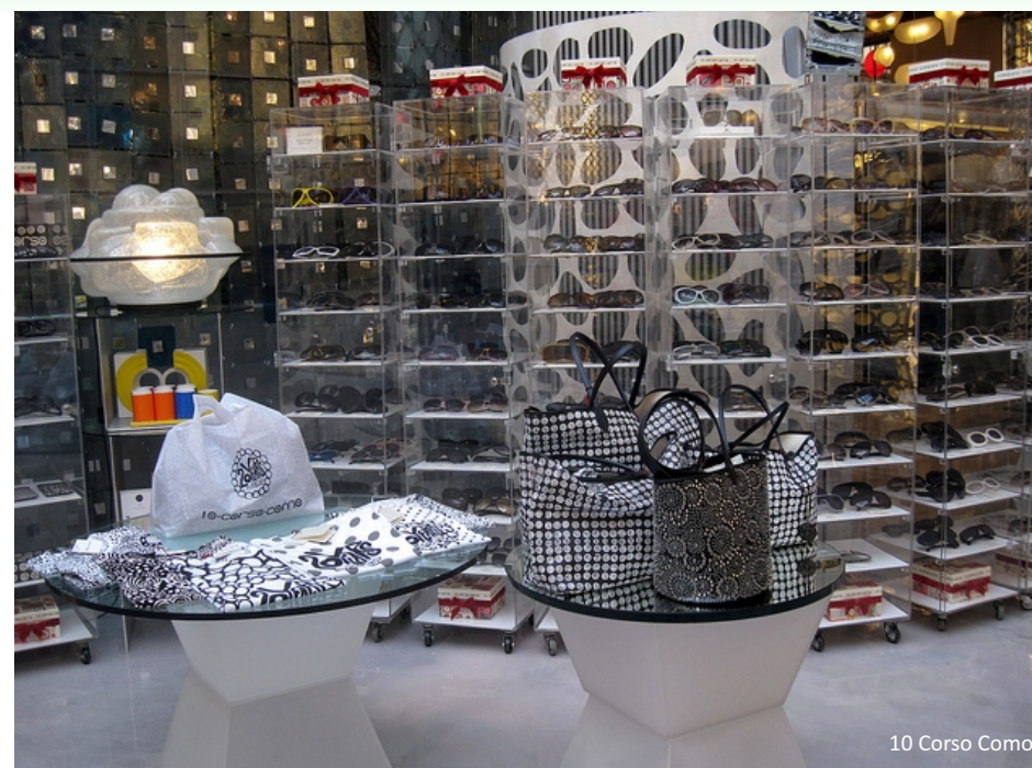
10 Corso Como

скачать и распечатать путеводитель вы можете на http://needguide.ru/