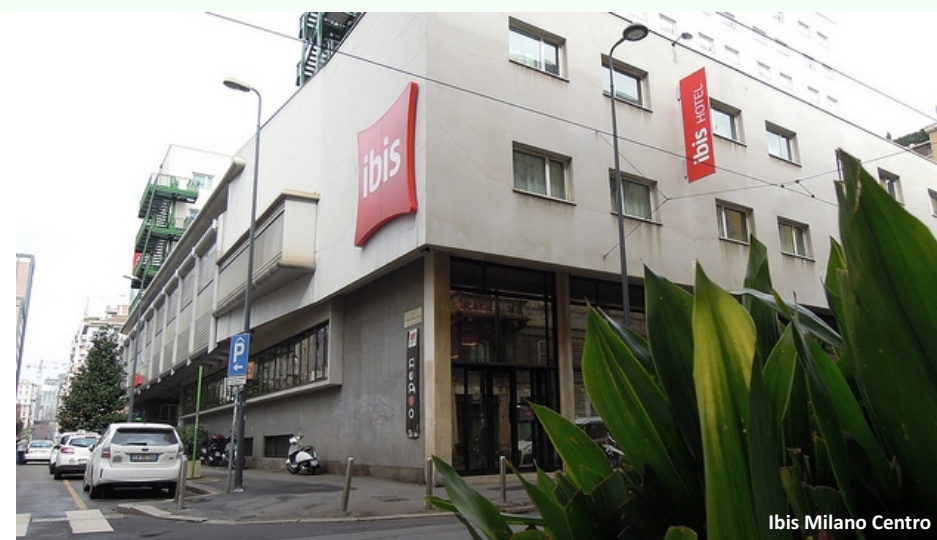
Ibis Milano Centro

скачать и распечатать путеводитель вы можете на http://needguide.ru/