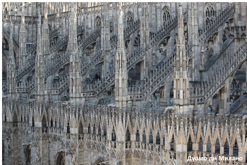
Дуомо ди Милано

Адрес: Piazza del Duomo, мимо не пройдете