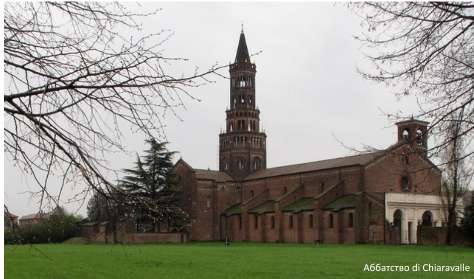
Аббатство di Chiaravalle